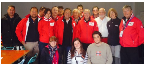
Course Croisière Edhec, les Sables d'Olonne (27 avril au 2 mai)